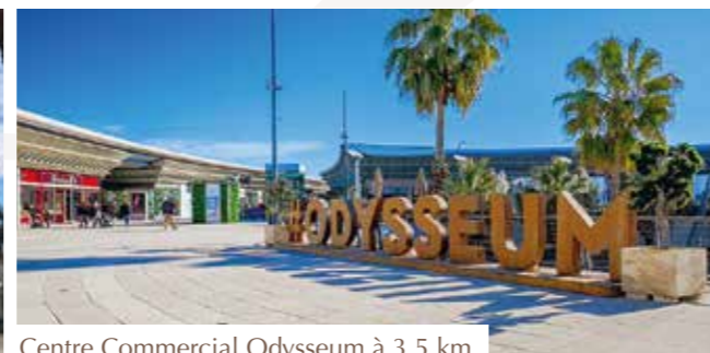
Centre Commercial Odysseum à 3,5 km