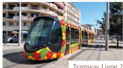
Tramway Ligne 2

Le verger et ses Halles : 4 ha de vergers s'étendent le long du boulevard Philippe Lamour, exploités selon une démarche d'agriculture raisonnée. Un espace dédié et chaleureux (Les Halles du Verger) offre la possibilité d'acheter la production locale en direct, et de partager de bons moments de convivialité autour d'un verre ou du terrain de pétanque !