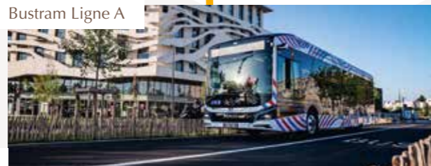
Bustram Ligne A