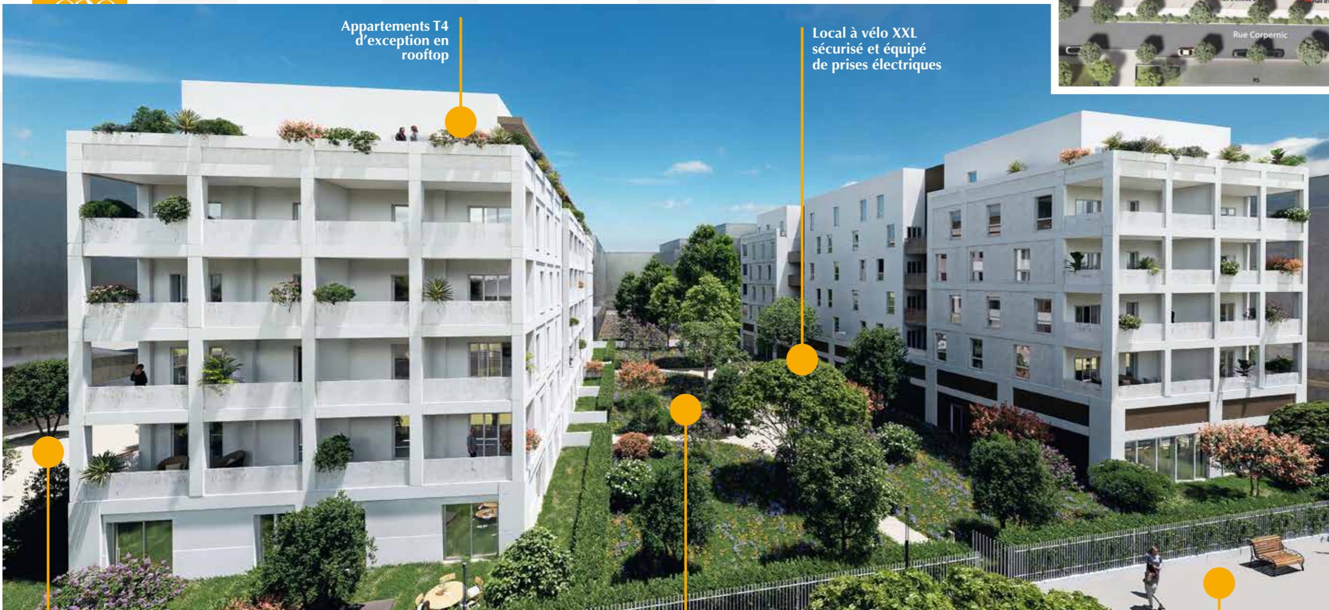
Appartements T4 d'exception en rooftop